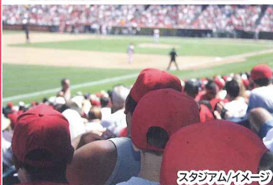
スタジアムイメージ