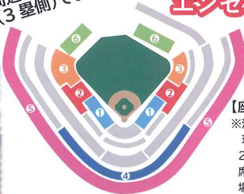
スタジアムイメージ

【座席について】 ※混雑状況や 現地事情により 2日目と3日目の 座席種が変更となる 場合もございます。