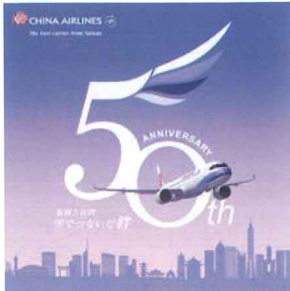
2026年China Airlineは、福岡就航50周年の節目を迎えます。

注意)スケジュールは、4月時点です。増便や減便もございますので申込時に販売店にご確認くださいませ。