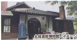
北投温泉博物館/イメージ

北投温泉博物館(月曜休館)観光と水美温泉会館にて温泉入浴。(昼食付) ●料金/24,000円(お1名様あたり)