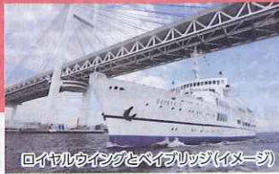
ロイヤルウイングとベイブリッジ(イメージ)

■代金(1名様):おとな:2,700円 小学生:1,800円 幼児(3歳以上):1,000円