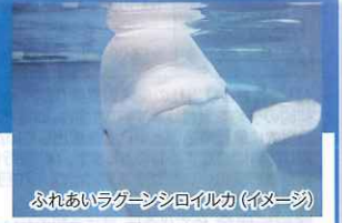
ふれあいラクーンシロイルカ(イメージ)

■代金(1名様):おとな:2,700円、小・中学生:1,620円 幼児(4歳以上):810円 ※シニア(65歳以上)の方は現地にてお買い求めください。