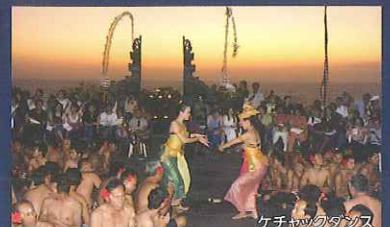
ケチャックダンス