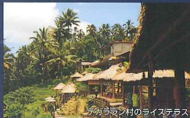
デガララン村のライステラス